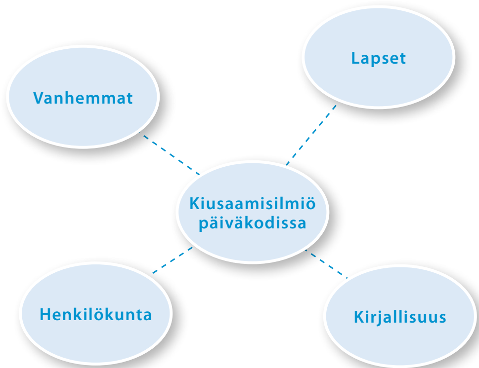
Kuva 1. Kiusaamisilmiön kuvailu eri näkökulmista Kiusaamisen ehkäisy alle kouluikäisten lasten parissa -hankkeessa.

Julkaisu on jaettu kolmeen osaan. Ensimmäisessä osassa on taustateoriaa kiusaamisesta ilmiönä sekä kirjallisuuskatsaus kiusaamisen tutkimuksesta alle kouluikäisten lasten parissa. Osassa kaksi esitellään hankkeessa kerätty aineisto. Siinä esitellään eri osapuolten näkemyksiä kiusaamisesta, kiusaamisen muodoista sekä paikoista, sukupuolieroista sekä kiusaamiseen puuttumisesta hankkeeseen osallistuneissa päiväkodeissa. Lisäksi kuvataan kiusaamiseen vaikuttavia tekijöitä, jotka nousivat aineistosta selvästi esiin, kuten vertaissuhteiden merkitys, aggressiivisesti käyttäytyvät lapset ja leikin merkitys. Aineiston tueksi aiheesta esitellään myös teorian tietoa. Kolmannessa osassa on johtopäätöksiä kiusaamista ehkäisevistä toimintatavoista sekä pohdintaa. Raportti julkaistaan suomen- ja ruotsinkielellä ja se on suunnattu lasten kasvatustehtävissä työskenteleville, alan suunnittelu- ja johtotehtävissä toimiville sekä opiskelijoille.